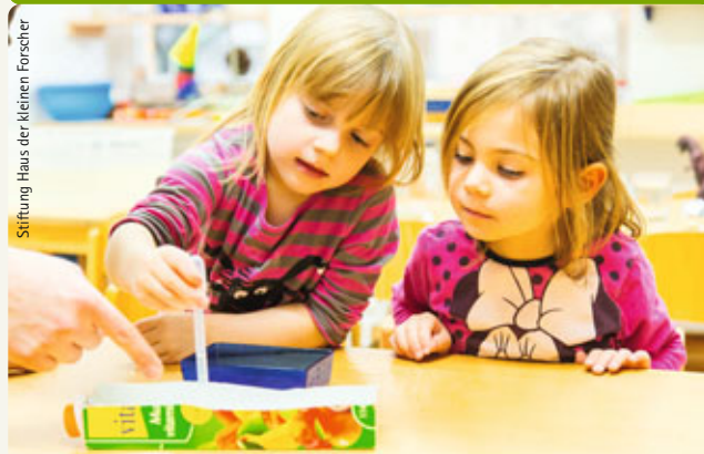
Stiftung Haus der kleinen Forscher

Als Lernbegleitung mit Begeisterung und Freude die Welt entdecken