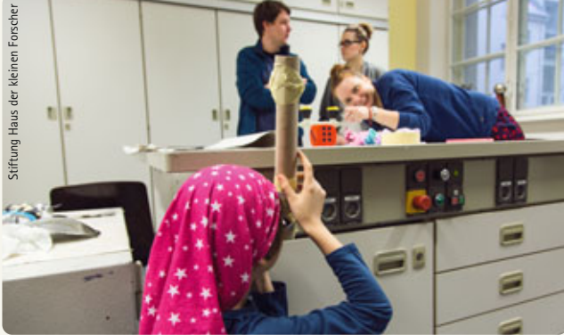
Stiftung Haus der kleinen Forscher