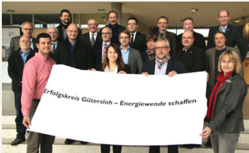
Die Lenkungsgruppe des Integrierten Klimaschutzkonzeptes des Kreises Gütersloh.

Die Themen Energie, Klima- und Ressourcenschutz können so erlebt und entdeckt werden und ein Bewusstsein dafür bereits früh entwickelt werden. Ein wichtiger Beitrag, um den Kreis Gütersloh bis 2050 energieautark zu gestalten, kann so geleistet werden.