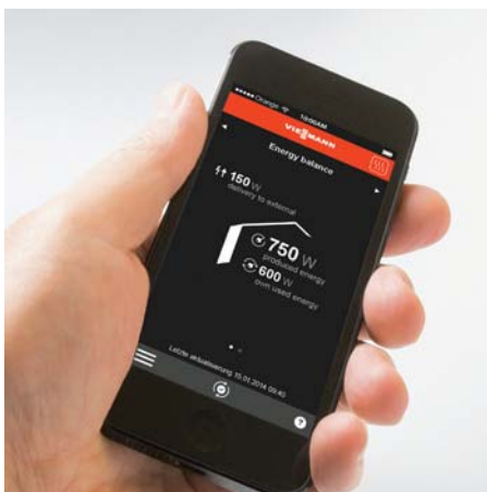
Fernbedien- und -überwachung über Mobiltelefonnetze in Verbindung mit der Vitotrol App für Vitocalor 300-P